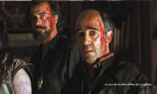
Le jour de la bête d'Alex de La Iglesia