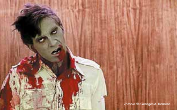
Zombie de Georges A. Romero