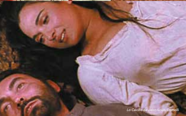
La Cécilia de Jean-Louis Comolli