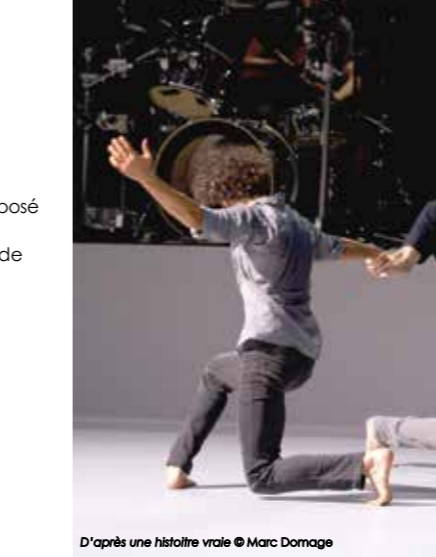
D'après une histoire vraie