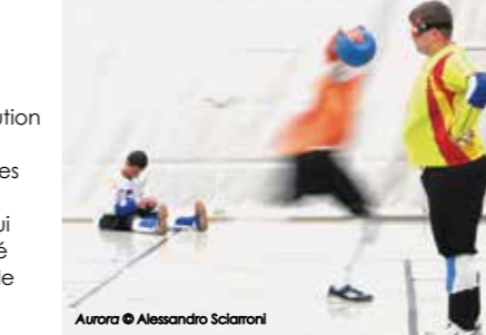
Aurora © Alessandro Sciarroni

Le chorégraphe italien Alessandro Sciarroni fait aux spectateurs une proposition originale : assister à un match de cécifoot avant de les amener à partager le rapport au monde des aveugles et malvoyants où l'ouïe est prépondérante. Une expérience sensorielle rare !