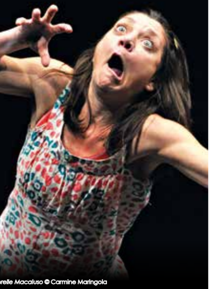
Le sorelle Macaluso © Carmine Maringola

Bernard, dit Mickey le Rouge en raison de sa chevelure rousse, a posé des bombes aux États-Unis pendant la guerre du Vietnam. Dans les eighties, il combat le libéralisme déchainé et rencontre la belle et rousse Leigh-Chéri lors d'un congrès écologique. Vont-ils trouver une manière de vivre leur relation amoureuse tout en restant contestataires ? Un spectacle drôle et profond de Thomas Condemine.