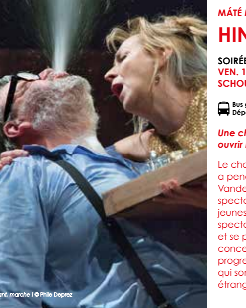
En avant, marche !