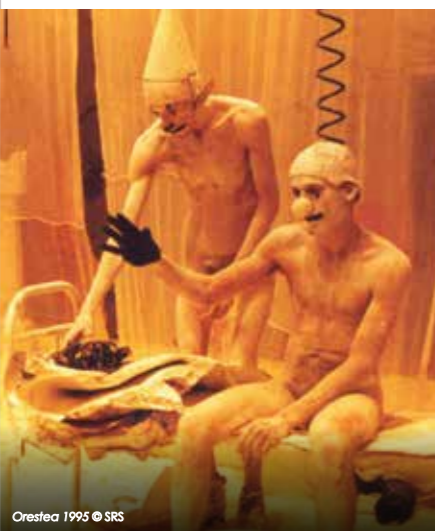
Orestie 1995

Du mythe, on se souvient du retour d'Agamemnon dans Argos après la guerre de Troie, Argos où sa femme Clytemnestre et son amant Egisthe ont pris le pouvoir, Argos où il se fera assassiné avec sa captive prophétique Cassandre qui voit sa propre mort en face... Une Clytemnestre obèse parce qu'affamée de pouvoir, un Oreste anorexique parce que trop faible pour agir, des singes pour les déesses de la vengeance, un homme-lapin blanc en chef du chœur antique... Des corps qui parlent d'eux-mêmes, pure matière de théâtre, un univers d'une puissance rare, pour dire l'éternel tragique du monde.