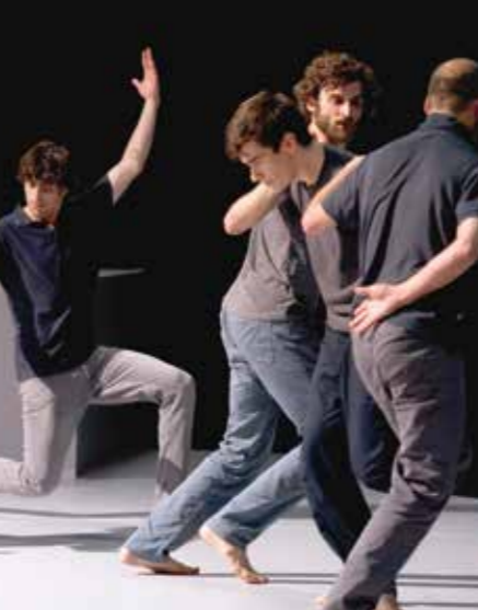
Western Society © David Baizor

I.C.I - CENTRE CHORÉGRAPHIQUE NATIONAL DE MONTPELLIER LANGUEDOC-ROUSSILLON — CHRISTIAN RIZZO (FR) D'APRÈS UNE HISTOIRE VRAIE MER. 18 — 20:00 / JEU. 19 — 19:00 VEN. 20 MAI — 20:00