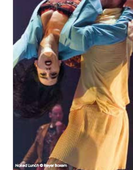
Naked Lunch