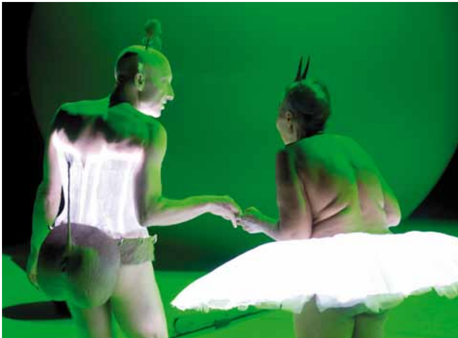
↑ The Cradle of Humankind

NEXT ARTS FESTIVAL EUROMETROPOLIS LILLE-KORTRIJK-TOURNAI + VALENCIENNES 15 NOV. AU 1 er DÉC. 2012