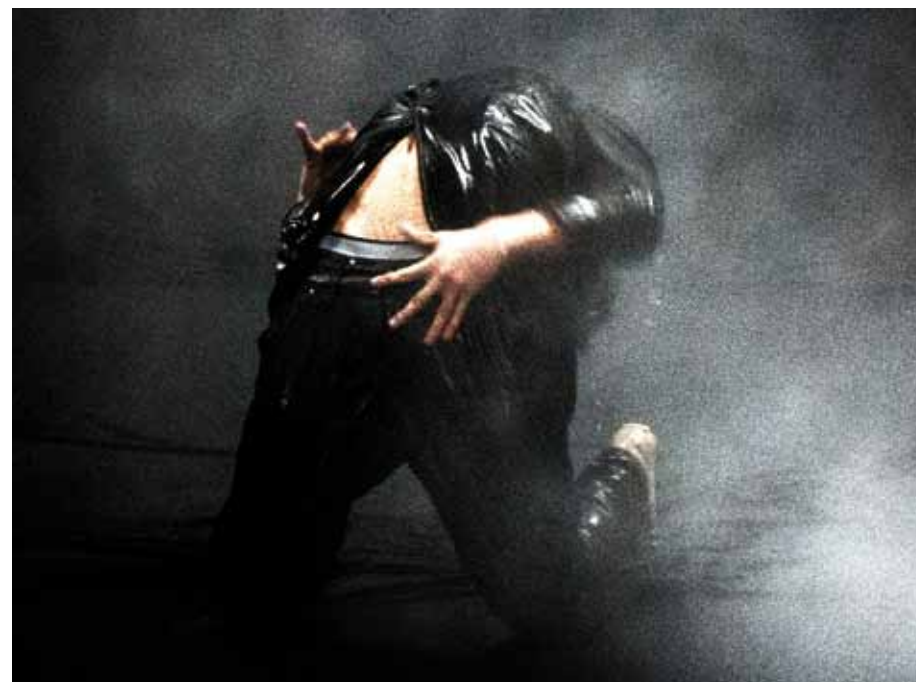
↑ The Old King

Avec le soutien de Union européenne : Fonds Européen de Développement Régional • INTERREG efface les frontières •