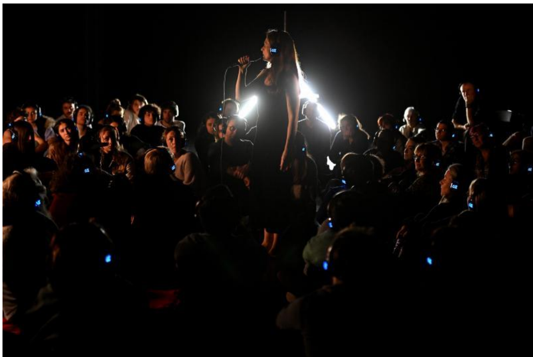
Les spectateurs sont au cœur de la pièce de théâtre.