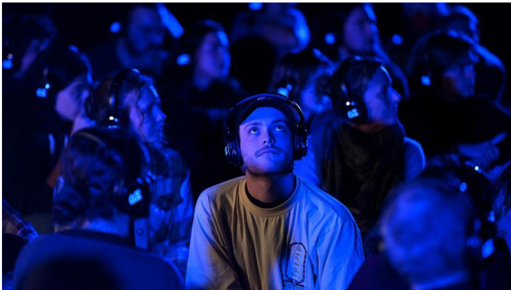
Les spectateurs immergés dans le récit de la pièce.

Ces jeudi et vendredi, les élèves du lycée Raymond-Queneau à Villeneuve-d'Ascq ont pu assister à « La Faille », une pièce de théâtre immersive mise en scène par Julien Bouffier. Grâce à cette représentation proposée par La Rose des Vents dans le cadre de son école buissonnière, les jeunes spectateurs sont devenus, à leur tour, acteurs.