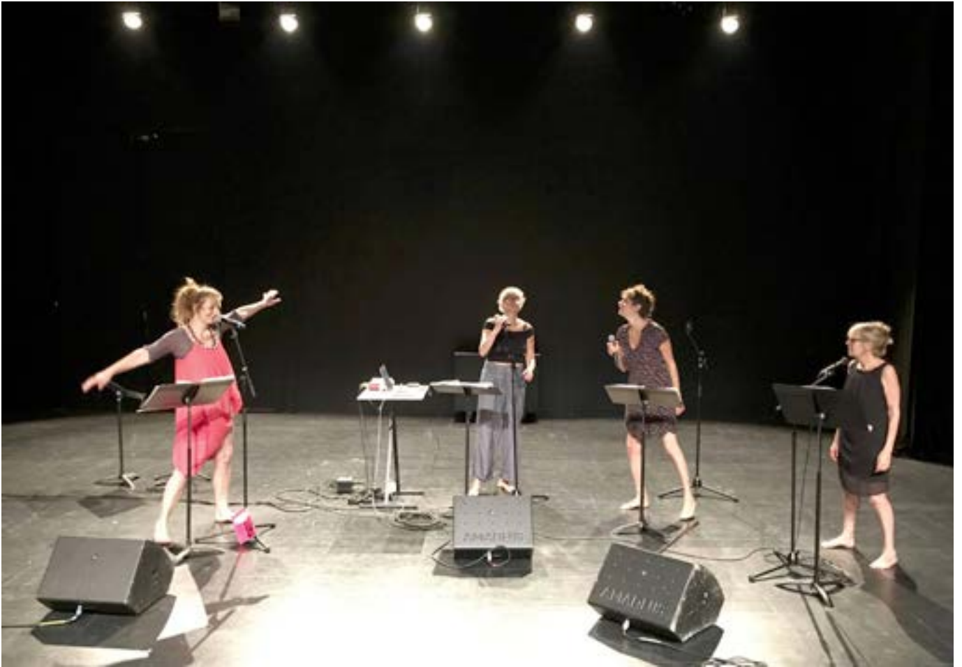
Le Parrain IV - Opér'Art Brut