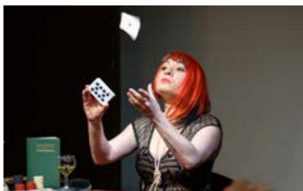
Magic Night

Cette première édition s'étalera sur six jours. Mais c'est dès février, à travers des ateliers Art et Science dans les établissements scolaires que Thierry Collet, artiste associé, et les artistes de la compagnie Le Phalène constitueront des « brigades magiques d'élèves ».