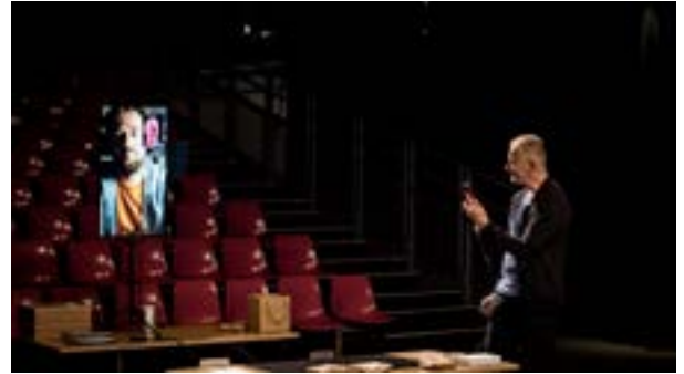
Que du bonheur (avec vos capteurs)

Plus que jamais tous les chemins de traverse mènent à La rose des vents.