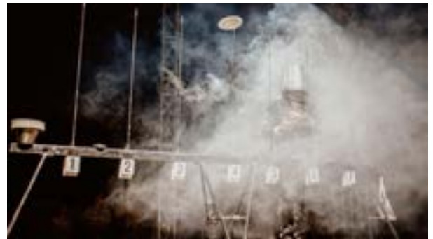
Der Lauf