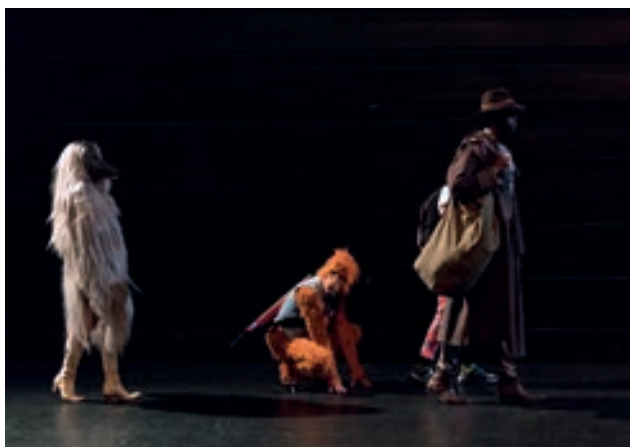
Le voyage avec Vitalis (sur la route d'Ussel).