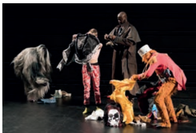
Essayage des costumes avant le spectacle, à Ussel.