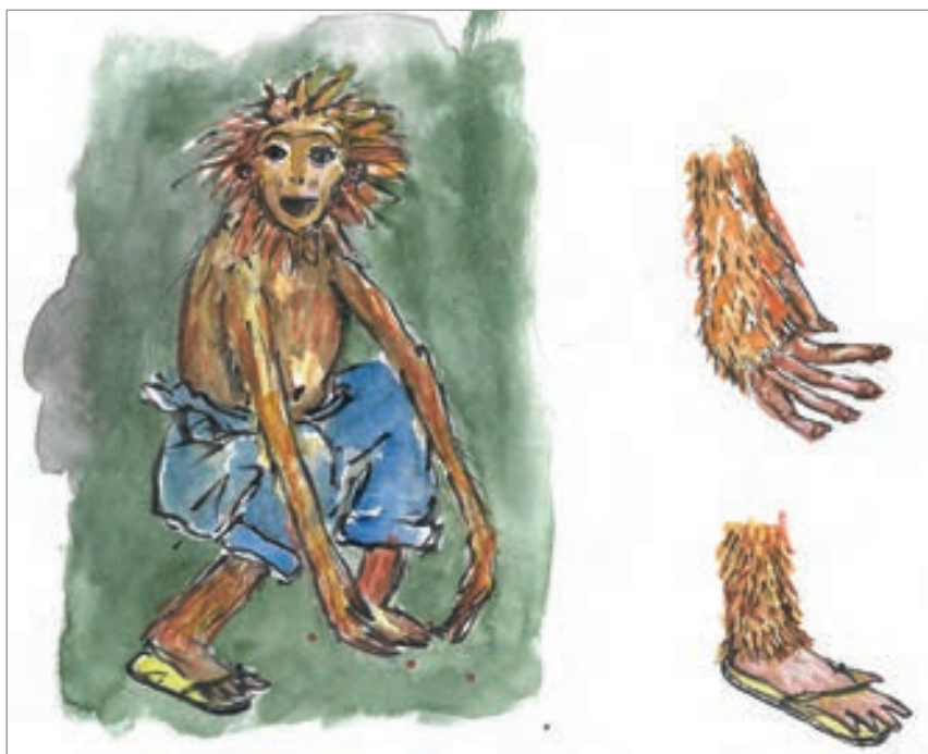
— Pour le costume de Joli-Cœur. © Colombe Lauriot-Prevost —