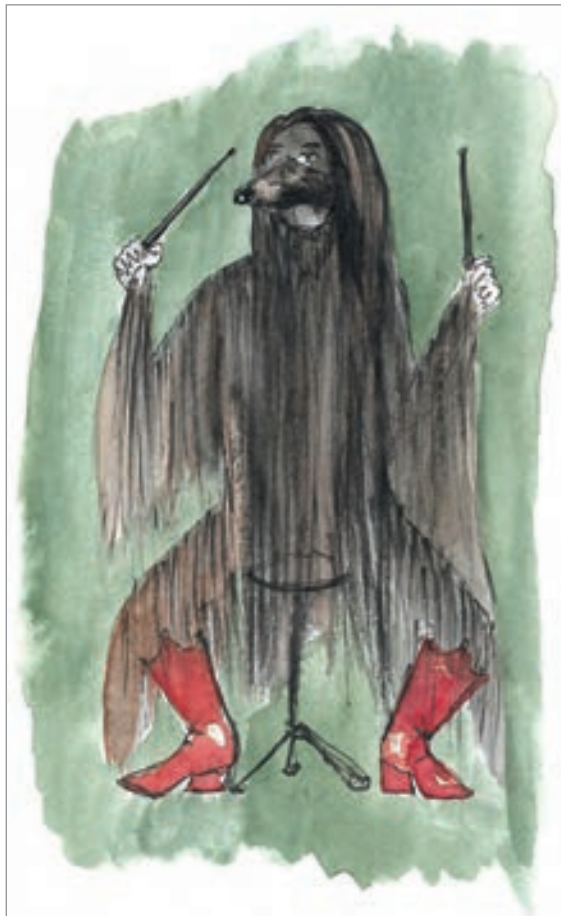
— Pour le costume de Capi. © Colombe Lauriot-Prevost —