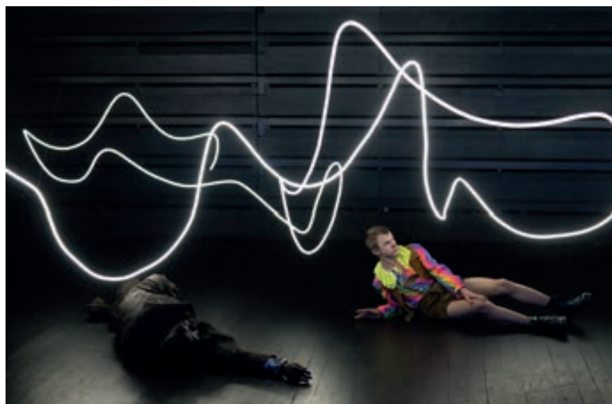
La mort de Vitalis.