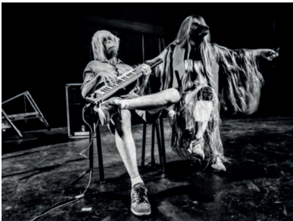
Joli-cœur et Capi (photos de répétition).

Deux par deux, les élèves établissent un dialogue vocal en répétant toujours le même mot (« famille », par exemple), mais en modifiant à chaque fois leur intonation. Les variations à donner sont indiquées par les autres élèves qui piochent à tour de rôle dans une boîte passée de main en main des morceaux de papier sur lesquels sont écrits des adjectifs (tranquille, souriant, gai, insouciant, pressé, apeuré, etc.) ou des noms communs (la sérénité, la confiance, la peur, l'inquiétude, les pleurs, la haine, l'amitié, la crainte, l'autorité, le tumulte, l'angoisse, la mort, l'emprisonnement, la maladie d'un être cher, etc.).