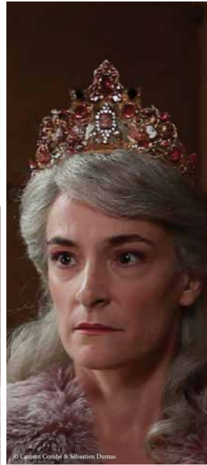
© Laurent Combe & Sébastien Dumas