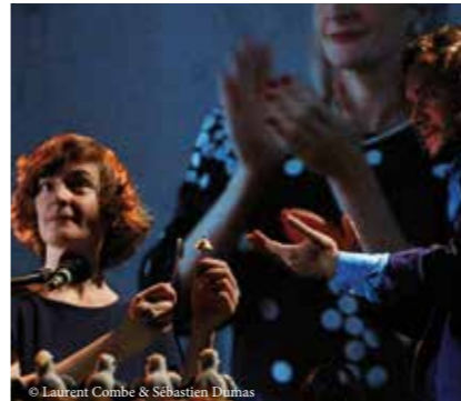
© Laurent Combe & Sébastien Dumas