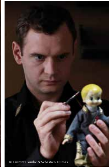
© Laurent Combe & Sébastien Dumas