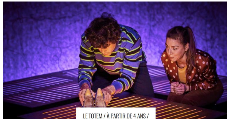
LE TOTEM / À PARTIR DE 4 ANS / AVIGNON OFF

Bastien sans main, une belle histoire de rencontre et d'acceptation